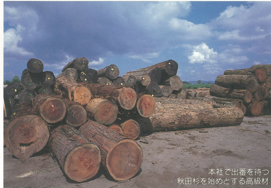
本社で出番を待つ秋田杉を始めとする高級材

限りある資源を丹精込めて育み、厳しく選び抜いた良質の木材が全世界のあらゆる産地から当社に送り込まれ、丁寧な管理・加工が施されます。