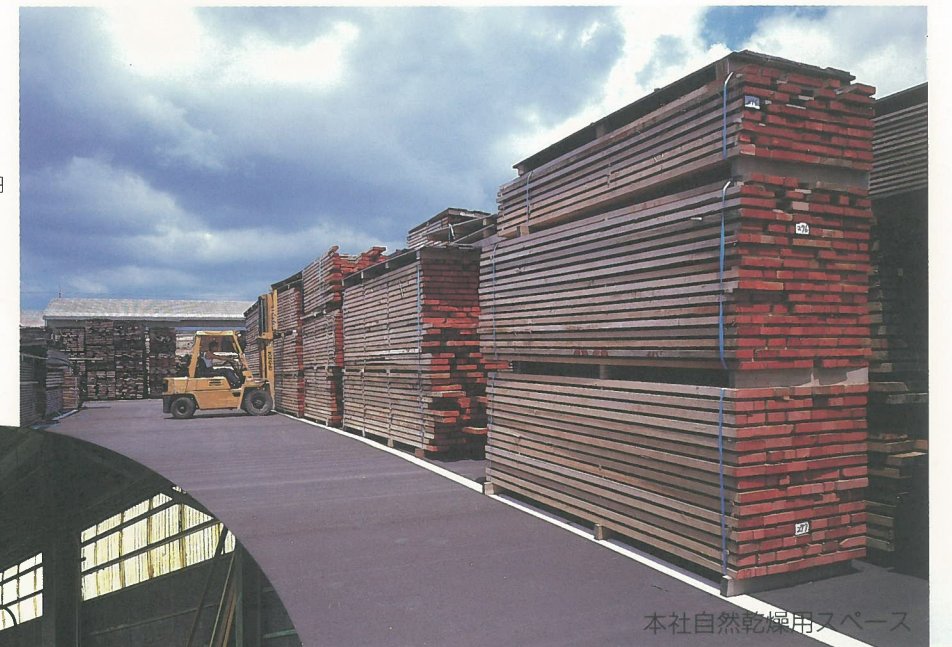
本社自然乾燥用スペース