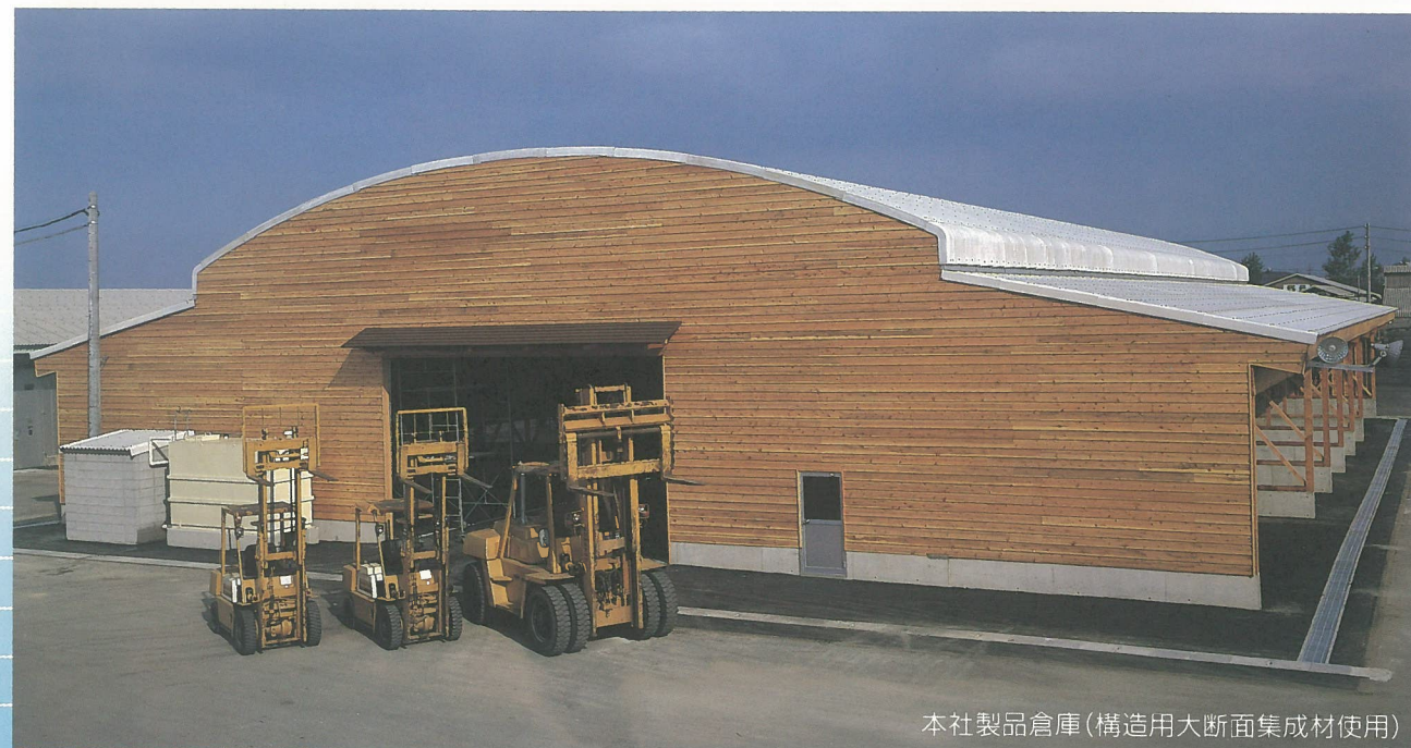
本社製品倉庫(構造用大断面集成材使用)