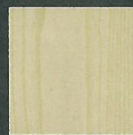
ホワイトアッシュ