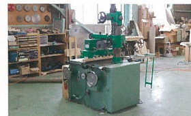
丸のこ盤 (溝付加工機)