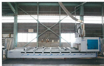
3次元 NC ルータ 有効幅 1500mm 長さ 6000mm (HOMAG 製)

お客様のニーズにお応えする為に、 大型機械から各種専用機械を取り揃えてあります。