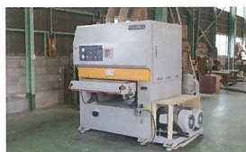
ベルトサンダー (有効巾 900mm)