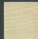
ホワイトシカモア