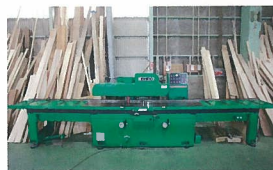
一面プレーナー (有効巾 500mm) 直角 2面カンナ