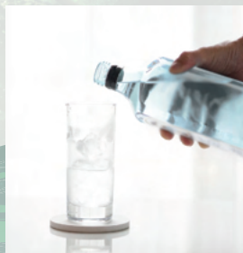
爽快でありながら個性的な味わいをお楽しみください