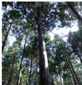
天然由来の美しい価値を

Directed by furutani lumber CO.,LTD Product of JAPAN