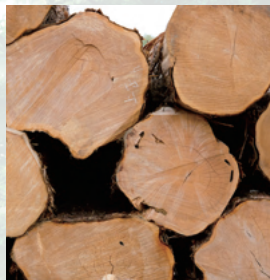
石川県の県木「能登ヒバ」